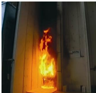
а – огневи тест на 3-4 мин.

Полученият резултат от проведеният тест: На 3-4 мин след началото на опита фасадата над корниза вече гори и отделя обилно количество дим и капещи горящи частици полистирол, които се наблюдават долу на пода при изпитанието – фиг.1а. След 8-мата мин опитът излиза от контрол, създава се ситуация огънят да се пренесе през фасадата до покривната конструкция, помещението се изпълва с гъст, отровен дим и екипът на пожарната служба от Брауншвайг, която присъства на опита е трябвало да загаси пожара като използва лични предпазни средства – изолиращи противогази, ръкавици, защитно облекло – фиг.1б.