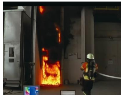
б – огневи тест на 8 мин.