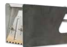
Кутия за лепило

mm лв./бр. 115 16.40 175 18.40 200 21.00 240 22.00