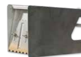
Кутия за лепило

mm лв./бр. 115 16.40 175 18.40 200 21.00 240 22.00